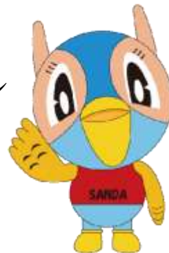
三田市マスコットキャラクター 『キッピー』