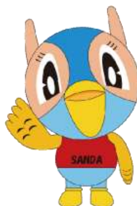
三田市マスコットキャラクター 『キッピー』