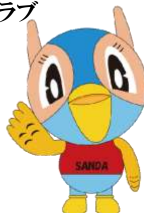
三田市マスコットキャラクター 『キッピー』