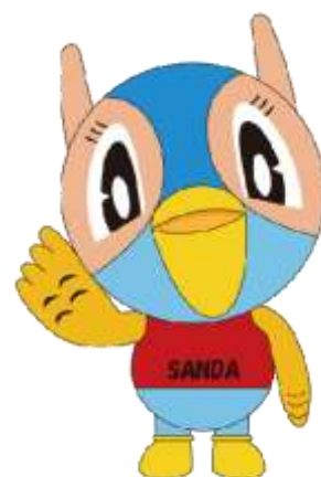
三田市マスコットキャラクター 『キッピー』